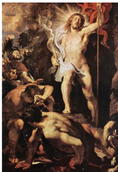
Panoul central cu Învieria lui Isus