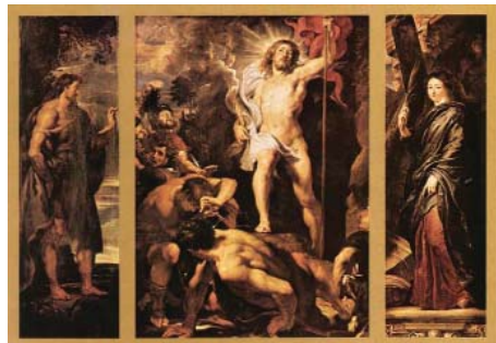
Tripticul Moretus pictat de Rubens

Panoul stâng al tripticului Moretus îl prezintă pe Ioan Botezătorul, patronul lui Jan Moretus, în tunica sa din păr de cămilă pe malul râului Iordan. Sabia care este la picioarele lui face aluzie la decapitarea sa. Panoul din dreapta o prezintă pe Sf. Martina, patroana văduvei tipografului, purtând o ramură de palmier care sugerează martiriul sfintei. Panoul central este dedicat Învierii lui Isus.