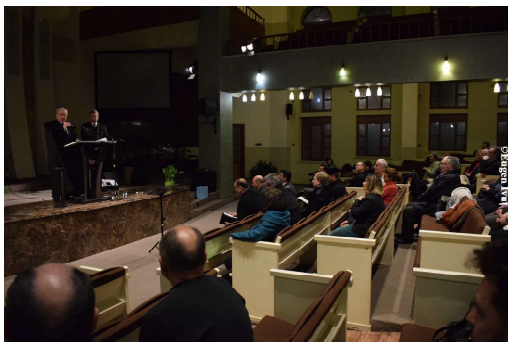
A cincea zi - Biserica Penticostală Betania