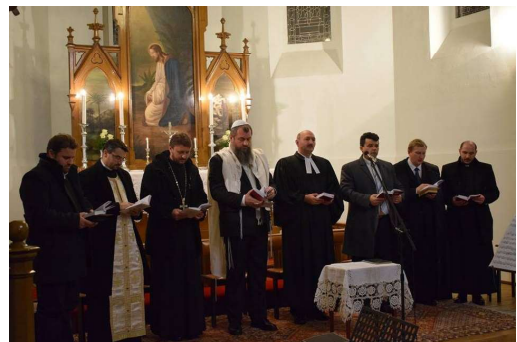
A șasea zi - Biserica Evanghelică-Luterană