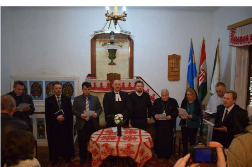
A opta zi - Biserica Unitariană din Oradea