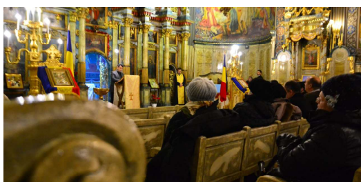
A noua zi - Biserica Ortodoxă Oradea