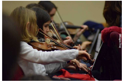
A doua zi - Biserica „Tabor” din Oradea