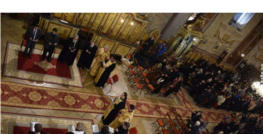
A zecea zi - Catedrala Greco-Catolică