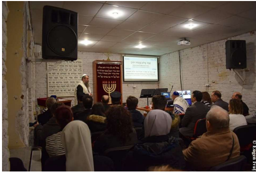
Prima zi - Sinagoga Comunității Evreilor Mesianici