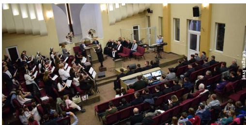
A șaptea zi - Biserica Penticostală Tabor