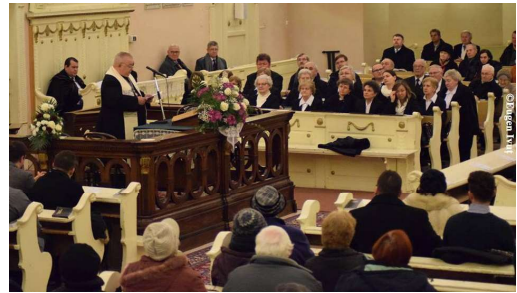
A patra zi - Biserica Reformată Olosig din Oradea