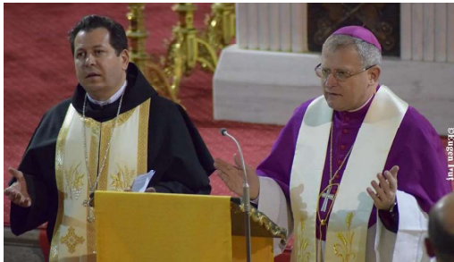
A treia zi - Catedrala Romano-Catolică din Oradea