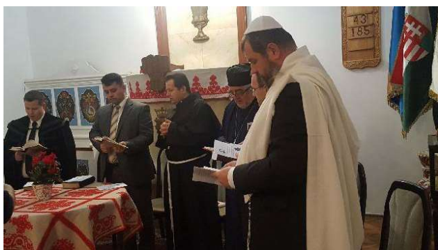
A treia zi - Biserica Unitariană