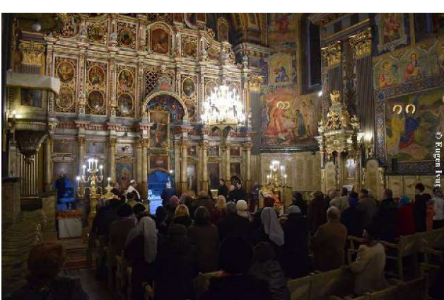
A opta zi Catedrala Greco-Catolică