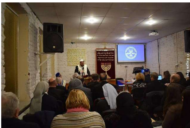
A șasea zi - Sinagoga Evreilor Mesianici