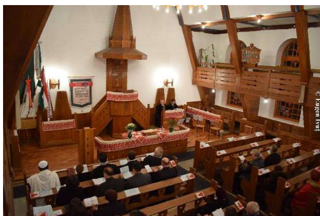
A doua zi - Biserica Reformată Rit