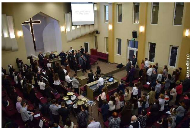
A cincea zi - Biserica Penticostală