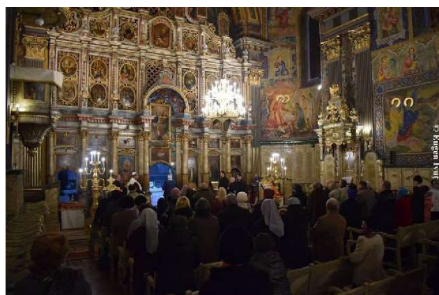
A șaptea zi - Catedrala Ortodoxă