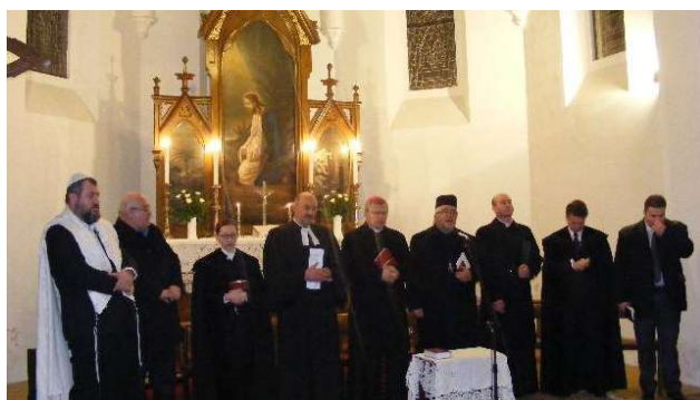
A patra zi - Biserica Evanghelică-Lutherană