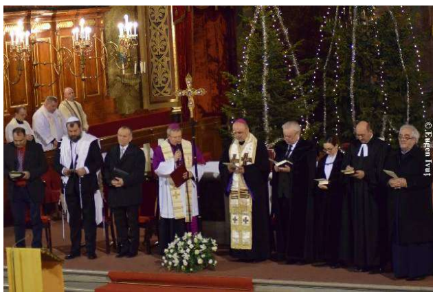
Prima zi - Bazilica Romano-Catolică