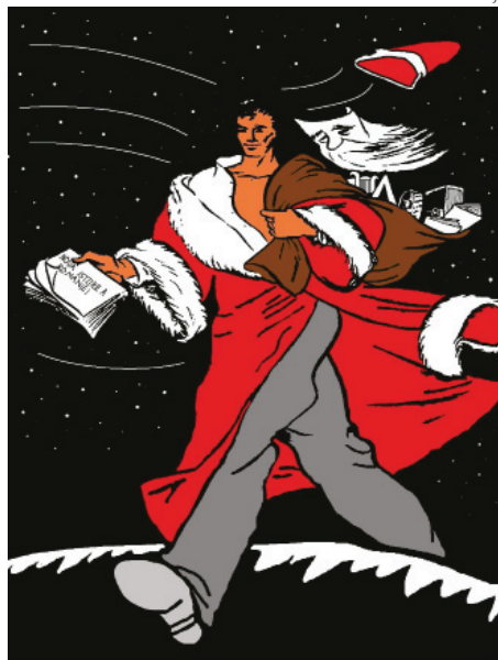
Moș Gerilă, fost Moș Crăciun, la 25 decembrie 1947 în Republica Populară România, fostă România

Dacă stăm și ne gândim, bietul Moș Crăciun nu o duce prea bine nici la începutul copilăriei mele fericite la umbra tancului sovietic. Atunci Moș